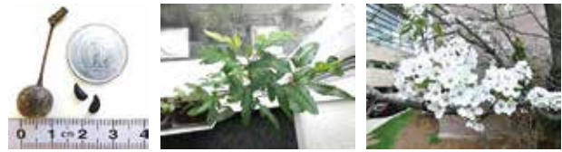
(左より：1円玉より小さいマメナシ果実と種子(2)より、発芽実験で生残した実生、米国ミシガン州のマメナシの花(2)より)

犬山市内で拾ったマメナシの果実から取り出した 20 個の種子について、直ちに発芽実験を行った。結果、8 割以上が発芽し、1 年後には高さ 65 cm 程に成長し、4 個体が生残した。すなわち、犬山のマメナシは、発芽能力はあるが、多くは成長初期に枯死すること、年間を通して明るく湿った環境があれば、潜在的に生育可能であることが示唆された。