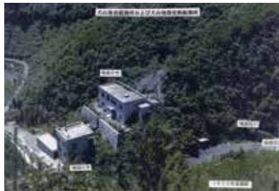
1970年当時の犬山地震観測所と地殻変動観測所

名古屋大学理学部附属犬山地震観測所は地震予知計画がスタートした 1965 年に犬山市の奥入鹿から、五条川に沿って上流に 2km ほど林道を進んだ（犬山市八曾）国有林の中に建設された。当時は国有林内で作業をする営林署職員をまれに見る程度で、人影もほとんどないごく静かな場所であった。2 年後には地殻変動観測所が併設され、全体で 6 人の職員が常駐して観測・研究に当たった。