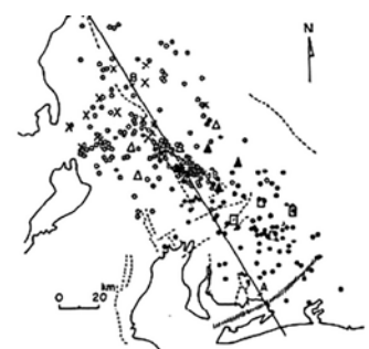
Fig. 7. Distribution of epicenters obtained from four temporary observations in 1963, 1964, 1968 and 1969. x: observation stations in 1963 and 1964. Δ: observation stations in 1968. □: observation stations in 1969. ●: Inuyama seismological network.

微小地震の研究からは、地震予知計画で期待された大地震の予兆を見出すことはできていない。しかし長年の観測・研究から、微小地震活動と活断層の関係やプレートの潜り込みに伴う地震活動などの理解は確実に進んだ。なお、地震予知に関する種々の研究は引き続き進められている。