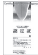
サプリメント管理士 認定証