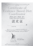
ダイエットコーディネーター 認定証